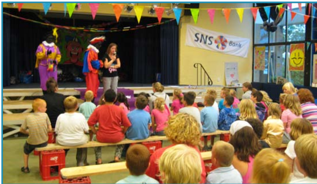
Er kwamen zelfs nog pieten pepernoten brengen.

Vandaag vieren we namelijk kerst op Kriebeldam. Kerst midden in de zomer. We wilden eigenlijk ook nog een hele grote kerstboom in de zaal zetten maar ook daar