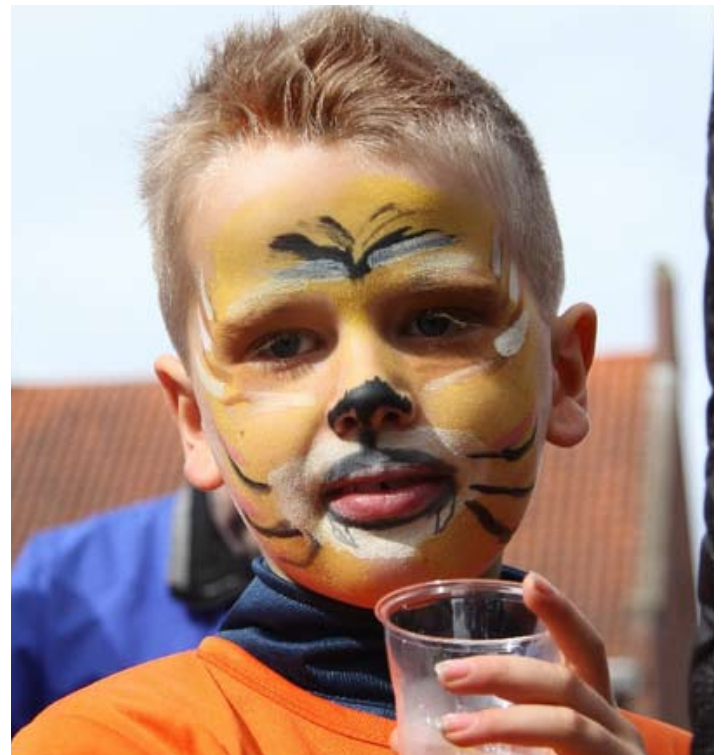
Geschminkt als leeuw tijdens Koninginnedag