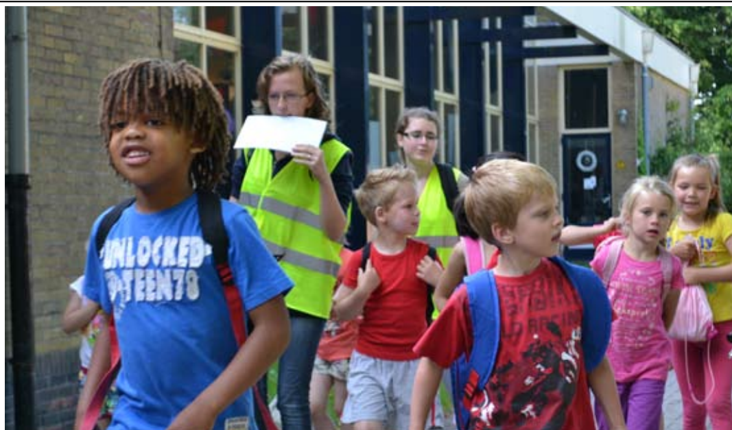
Wij zijn er klaar voor, laat de speurtocht maar beginnen!

Daarom het verzoek om kinderen dan ook niet eerder dan deze tijd te komen brengen. Indien kinderen toch voor deze tijd aanwezig zijn is dit ten alle tijden geheel op eigen risico.