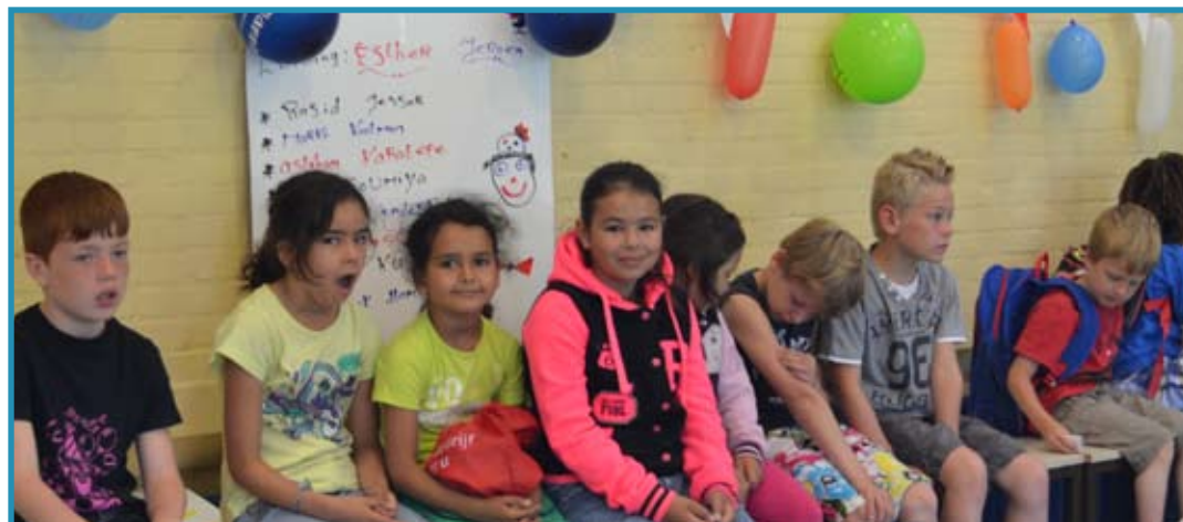
Nog even wachten en dan gaan we weer beginnen!

Daarna begonnen we twee keer aan het grote ruilspel. De eerste keer het ruilen van de kinderen in de groepen, daarna een ruil-speur-