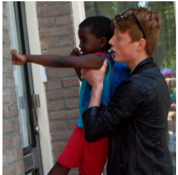
Ruilhandel: de deurbel zat alleen iets te hoog voor deze jongen!