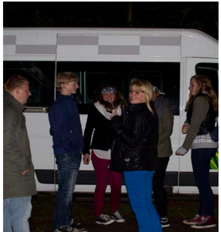
Leiding bij het busje waarmee ze "gedropt" werden.

Want er zijn natuurlijk altijd een hoop mededelingen die er in moeten, maar het liefste publiceren we natuurlijk de spannende verhalen en belevenissen van de kinderen.