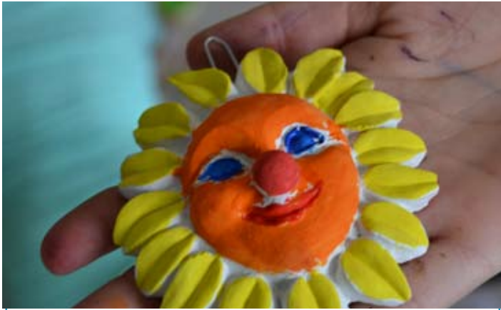
Clowntjes verven was een groot succes!