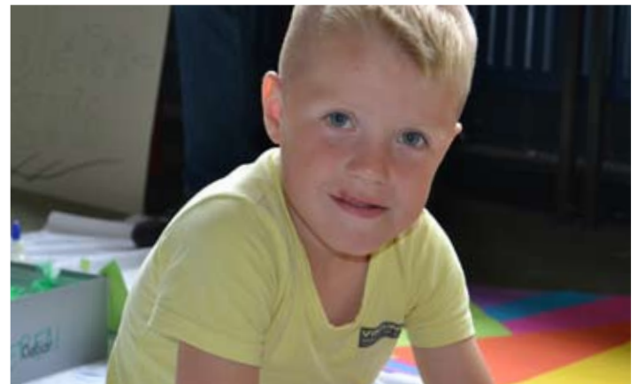
En het was weer een puinhoop, maar wel een gezellige puinhoop.