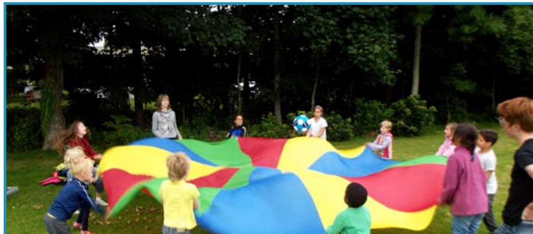
Lekker verkoeling zoeken bij het zwembad!

We gingen toen allemaal groepsspellen doen de hele middag. We deden gekke dingen zoals kruiwagentje spelen, en met de