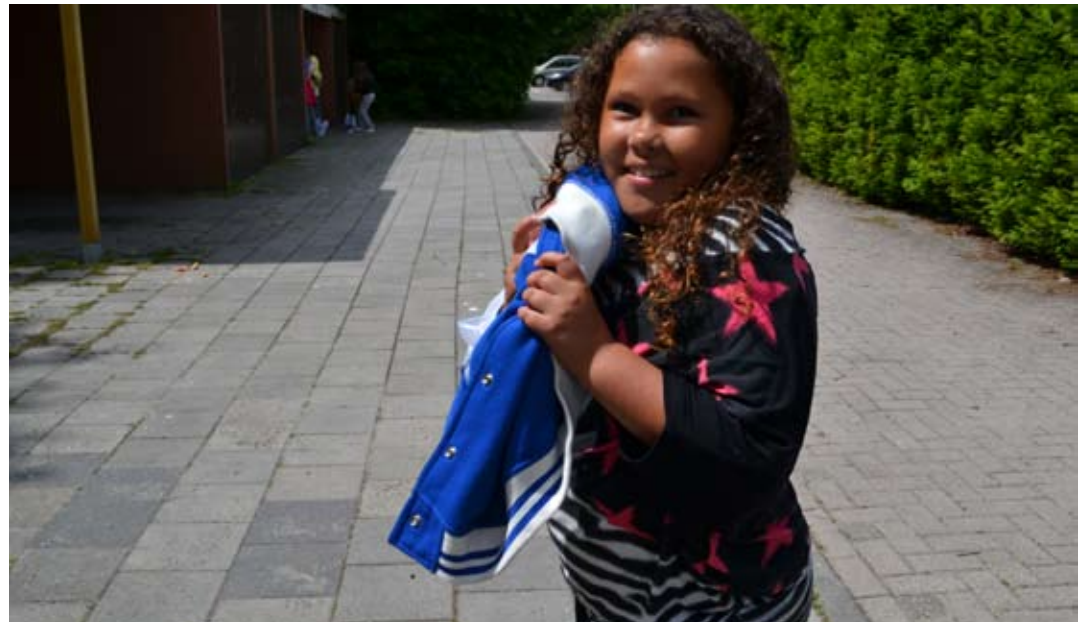
Tja als je niet op de foto wilt dan kom je er natuurlijk juist op. En nog in de Kriebeldammer ook!

Vergeet je niet je naam en groep in het shirt te plakken? Anders weten we niet van wie het is!