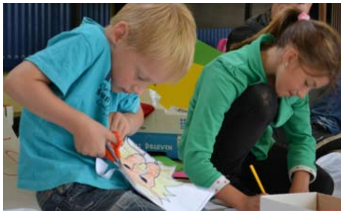
Dierenmaskers... Veel werk, maar o-zo mooi!