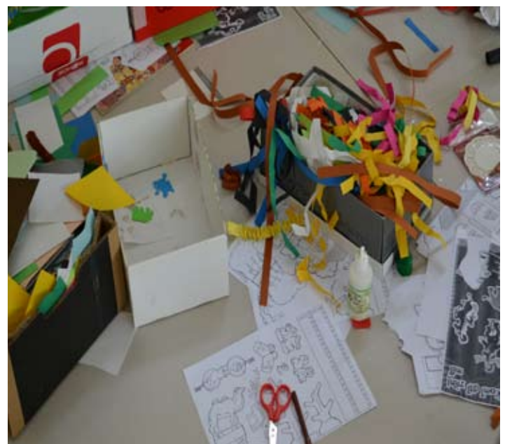
Wie gaat dit straks allemaal weer opruimen?