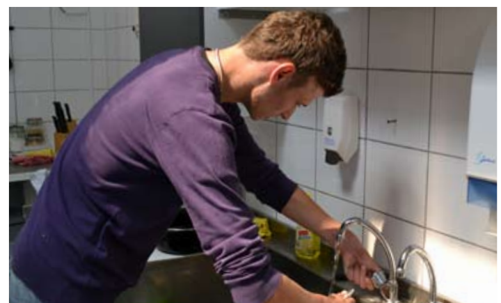
Na het pannenkoekenbakken gaan we... Afwassen dus!