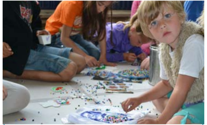
Ja hoor, ook bij strijkkralen kom je gewoon op de foto ;-)