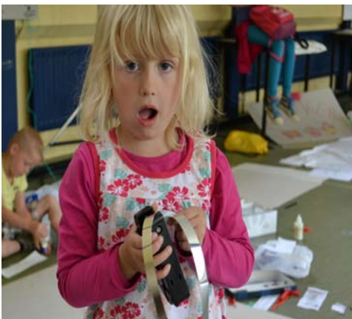
Wel gaan wel lekker nieten... of niet... Jawel!