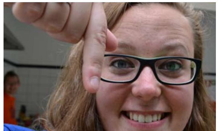
Ja Cynthia, ook jongens kunnen best wel afwassen hoor ;-)