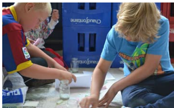
Zandkleuren blijft populair!