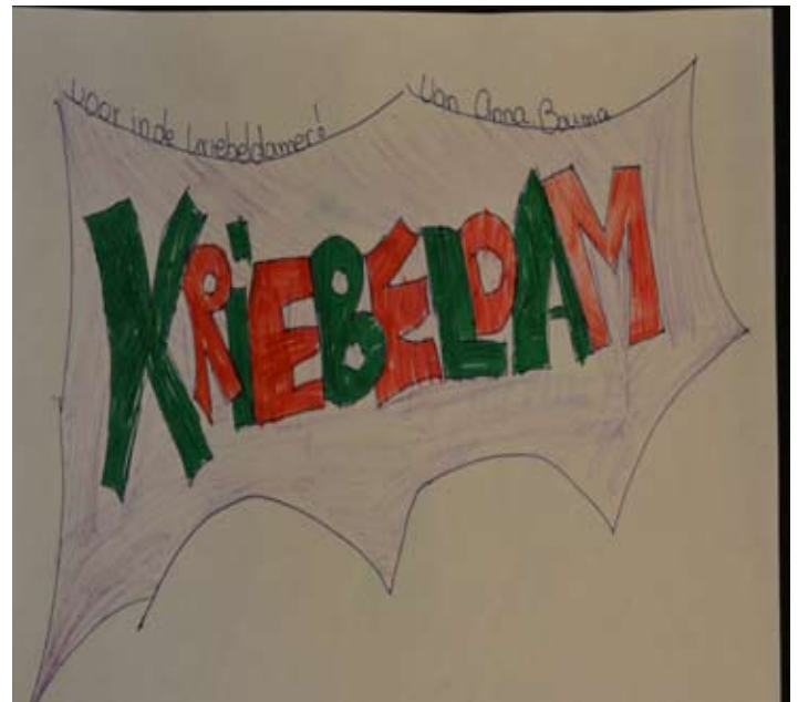
KRIEBELDAM door Anna Bouma, stoer hoor!