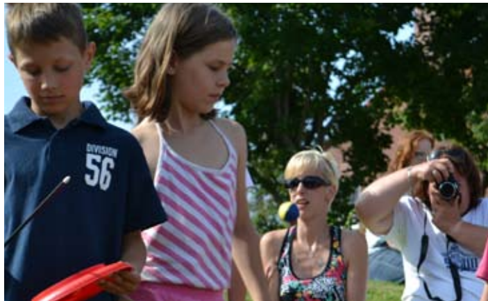
Op het veld tegenover de ASWA