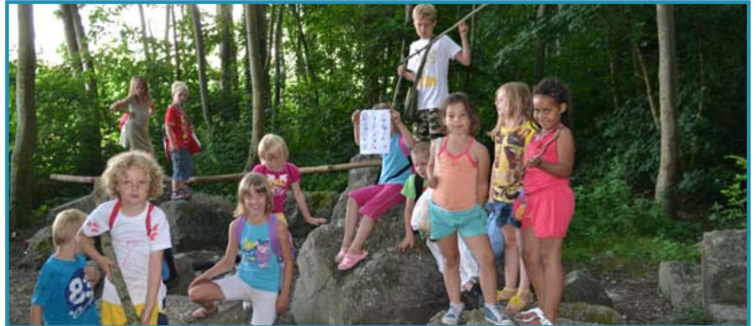
Even een groepsfoto maken in het bos tijdens het geluidenspel!

KRIEBELDAM - Gistermorgen waren alle jongste groepen vrij en de oudste groepen vertrokken al om 09.00 uur op de fiets naar Elders. Alle andere kinderen kwamen hier woensdagmiddag om 13.00 uur. We hebben toen eens een keer iets helemaal anders gedaan op de woensdagmiddag. We zijn allemaal gekke opdrachten gaan doen in het centrum. Alle groepen gingen naar het Kerkplein en kregen daar bij een post kaartjes met opdrachten en vragen. Hele normale vragen zoals "hoeveel hangende keukens zijn er" maar ook hele gekke opdrachten zoals "ga op pad en kom terug met een