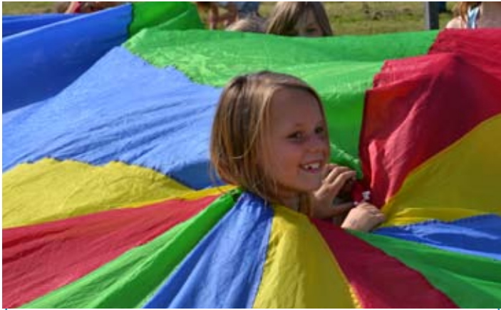
Hey, wat heb ik nou aan mijn parachute hangen?!