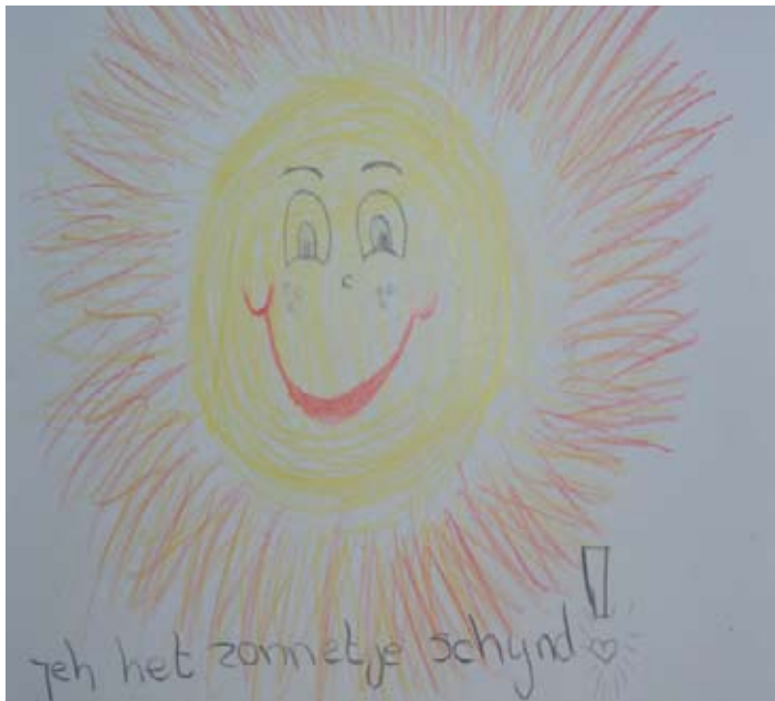
Het zonnetje schijnt inderdaad wel!

Van PH aan HB...zorg jij voor aardbeiden en beschuit dan kijk ik wat ik kan regelen voor je.