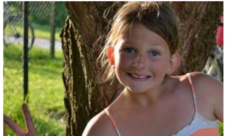
Smile, je staat in de Kriebeldammer!