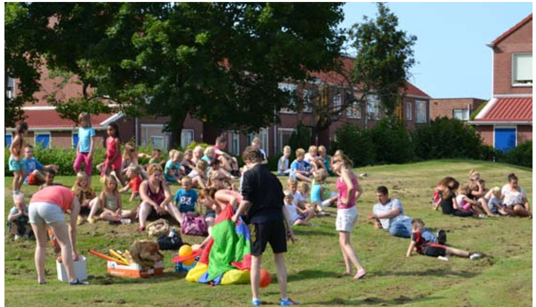
Spellen op het grote veld tegenover het ASWA-gebouw.

En tja... nu is deze dag ook al weer voorbij en is het morgen de alllllllerlaatste Kriebeldamdag van dit jaar. Jammerrrrrr! Morgen maken we er nog een spetterend feest van met elkaar toch? Zie jullie morgen! Dikkie Kriebel