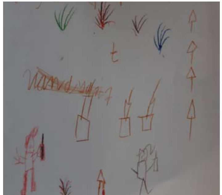
Een waar kunstwerk!