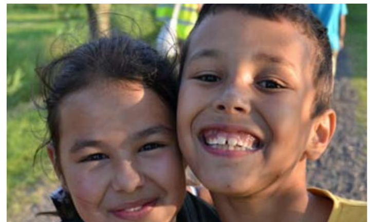
Awwww, wat zijn ze toch lief samen!