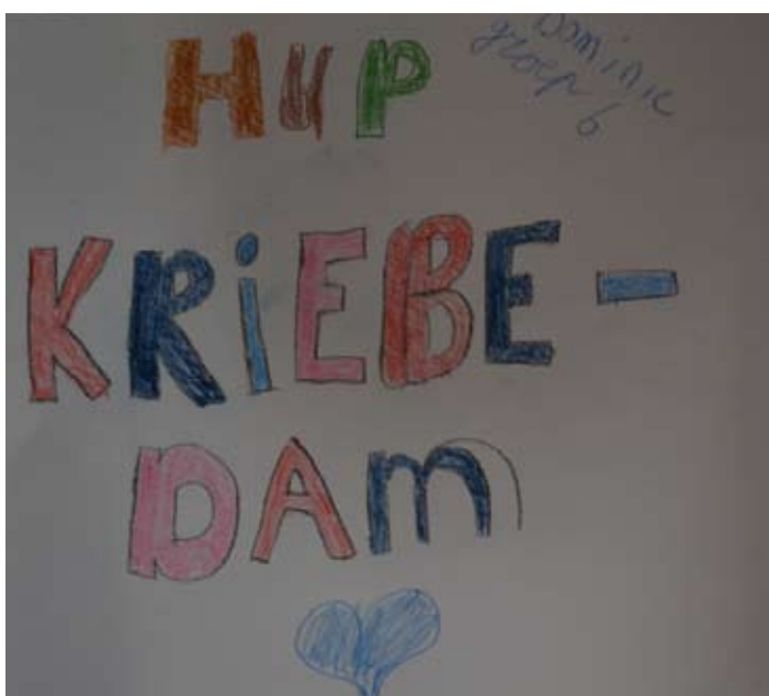
Dominique uit groep 6.