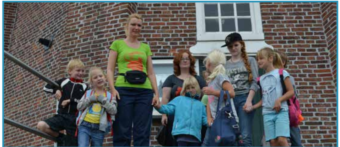
De jongste groepen brachten vanmiddag een bezoekje aan de molen in Delfzijl

KRIEBELDAM - Zo, de tweede week is weer van start gegaan. Wel erg rustig trouwens, want er doen lang niet zo veel kinderen mee als vorige week. Maar dat betekent natuurlijk niet dat we geen lol gaan hebben met elkaar. Vanochtend weer een leuke speurtocht gedaan met bolletjes en pijltjes. Daarna weer lekker bezig gegaan met de hutten. En toen gingen aan het begin van de middag de jongste groepen naar de molen in Delfzijl. Eerst ging de eerste groep met een busje naar Farmsum, daar staat ook een molen, maar de mevrouw van de molen had zich vergist want we moesten naar