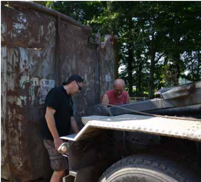
De container is weer geplaatst voor het hout!