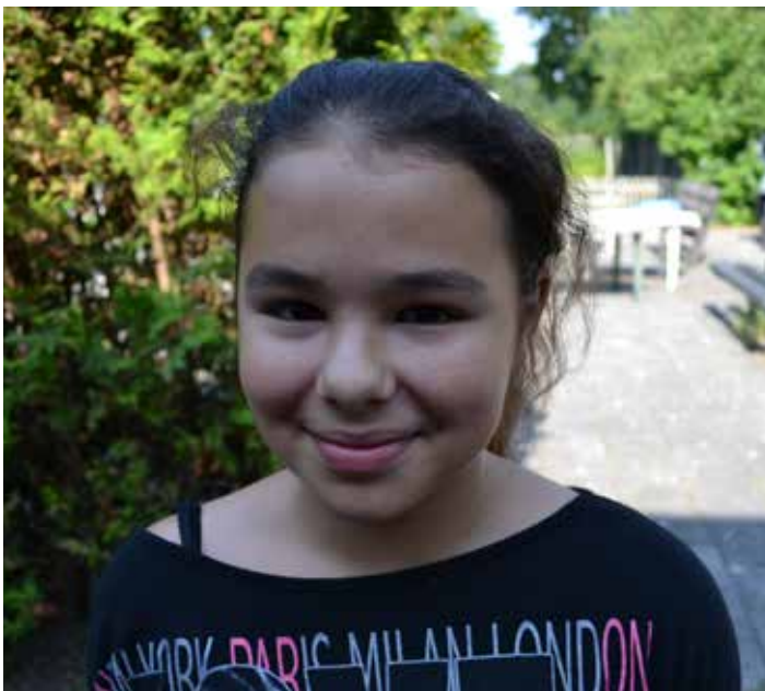
Smile! Je staat in de Kriebeldammer!