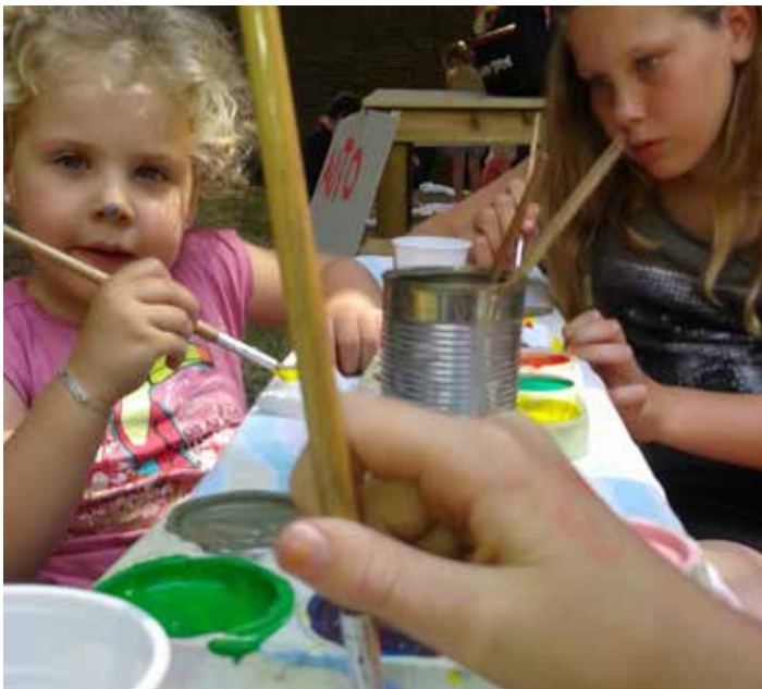
Alles wat je maakt moet natuurlijk wel geschilderd worden.