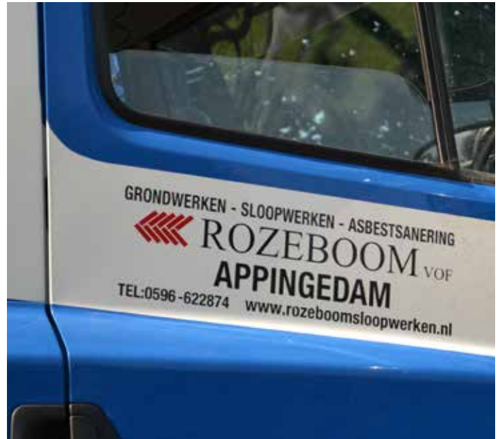
De container is beschikbaar gesteld door Rozeboom!