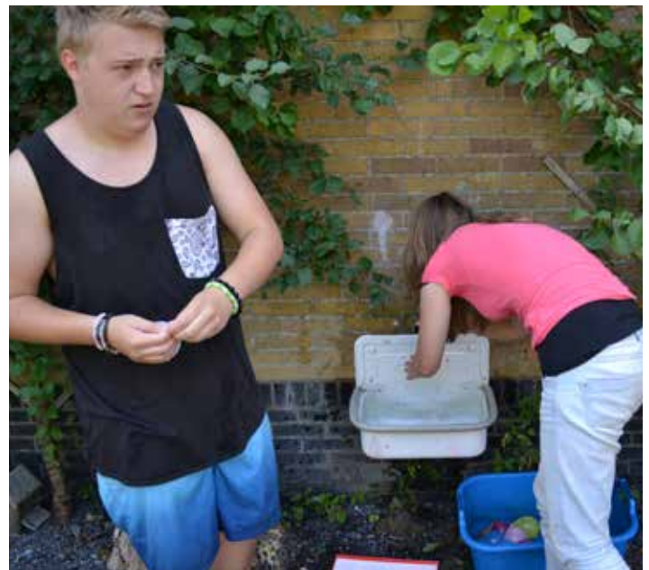
Waterballonnen vullen voor de waterspellen.