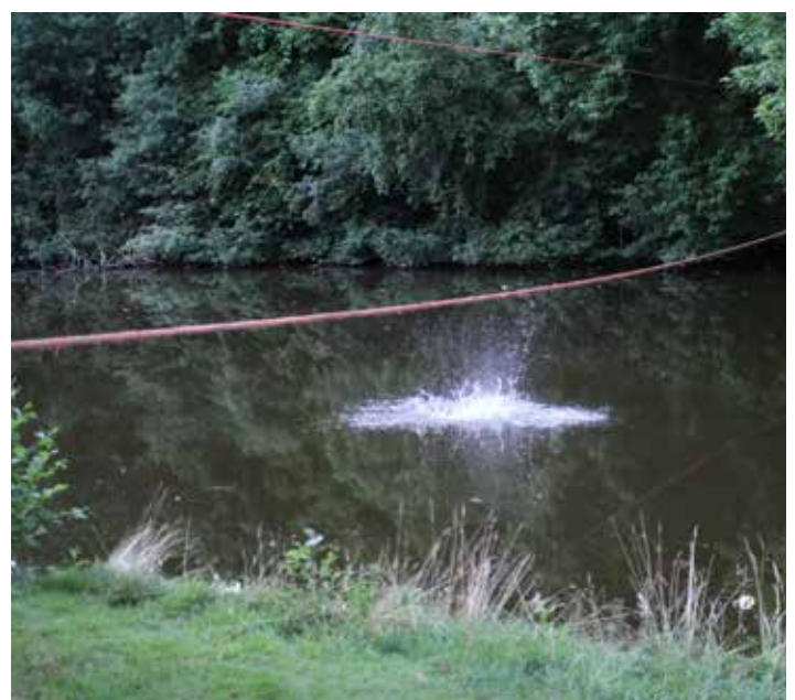
Droog blij je op Elders natuurlijk nooit (meer foto's op onze site)