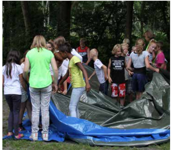
Tja hoe krijg je dat kleed weer onder je voeten weg...