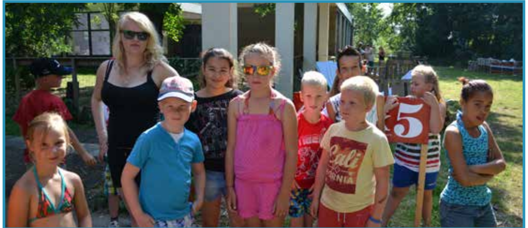
Wij zijn klaar voor de laatste Kriebeldamdag!

KRIEBELDAM - Hoi jongens en meisjes! Rare dag hoor hier op Kriebeldam. Het is al weer de laatste dag. Waren jullie allemaal net zo verdrietig als ik? Aan de ene kant was ik superblij dat ik nog een dagje heen mocht en aan de andere kant dus super verdrietig omdat het na vanavond allemaal al weer voorbij is. Hebben jullie de afgelopen week net zo veel lol gehad als ik? Je wilt niet weten hoeveel pannenkoeken ik heb gehad, hoe vaak ik wel niet geschminkt ben en hoeveel liters ranja ik wel niet gehad heb. Maar ik ben ook best wel een beetje moe hoor. Ik denk dat ik morgen lekker