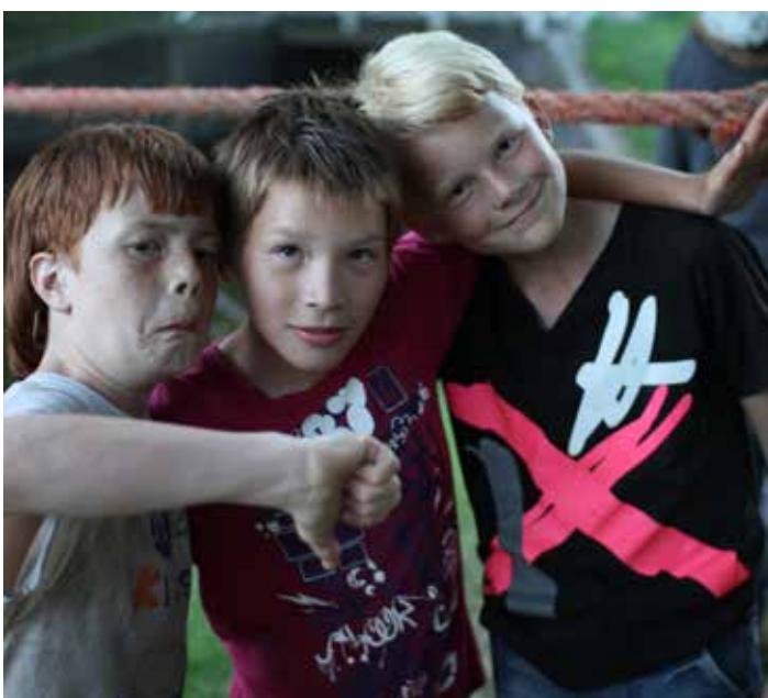
Gezellig boel met deze stoere gasten!