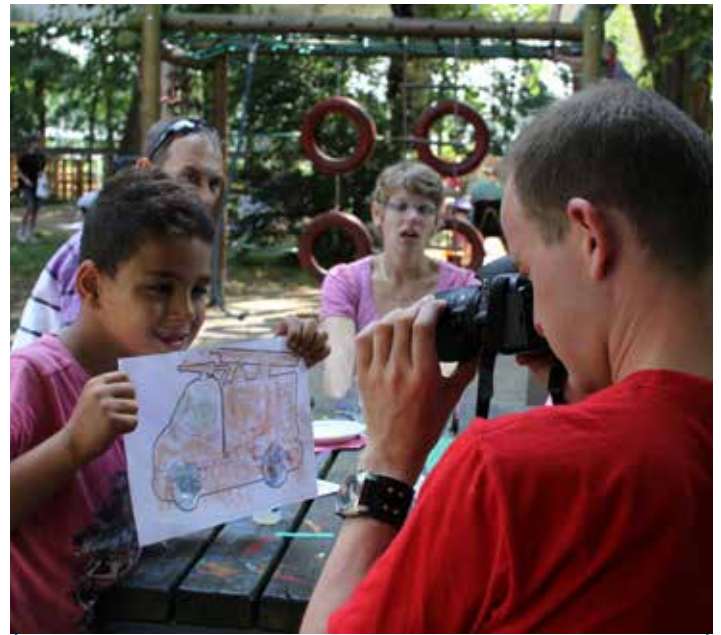
De fotograaf op de foto.