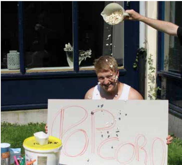
Sneeuw in juli? Nee popcorn!