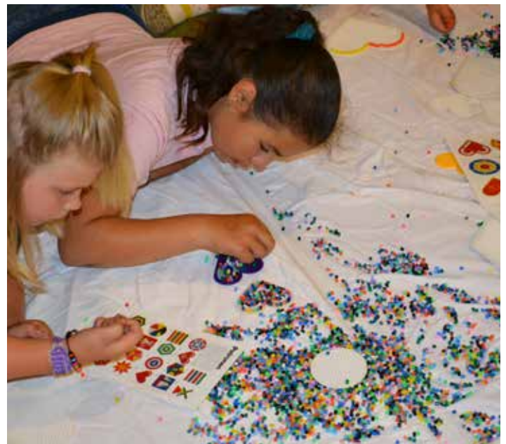
Strijkkralen blijven super populair!