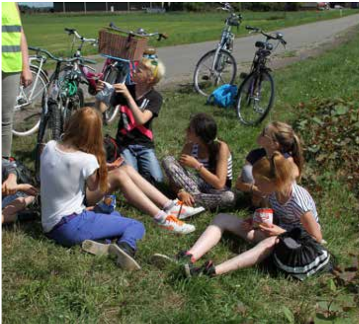
Uiteraard gaan we weer op de fiets!