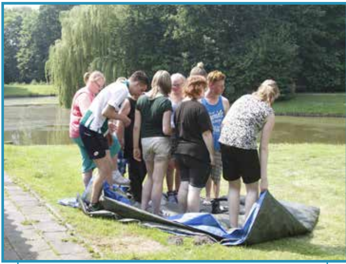
De leiding had zaterdag teambuilding op Ekenstein.