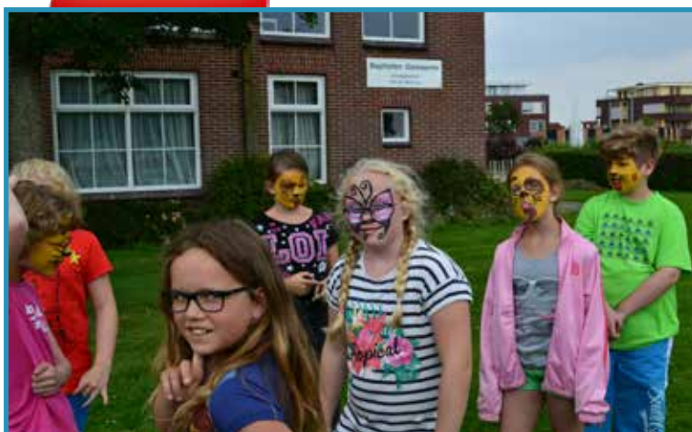
Vrijdagmiddag stond in het teken van een spellencircuit.