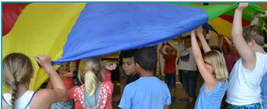
Het parachutespel blijft een ontzettend leuk spel!

Ben je wat kwijt? Kijk dan vanavond nog even in de doos met gevonden voorwerpen op het podium.