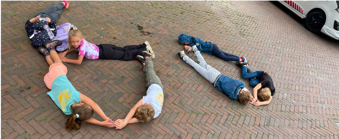
Beeld het getal 60 uit met de kids

NUMMER 3 | DINSDAG 7 JULI 2026 | 60 STE JAARGANG